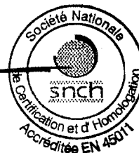
Claude LIESCH Direction