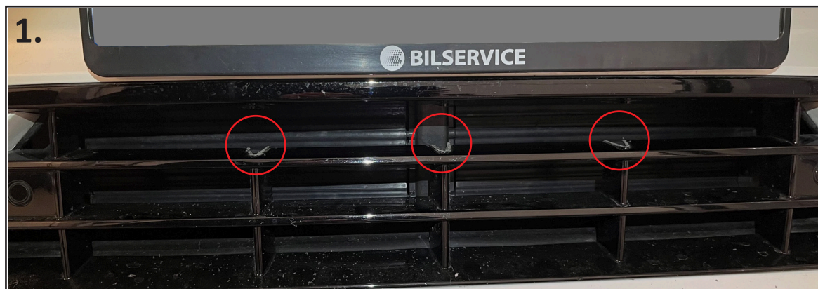
1. Skjær bort de tre vertikale spilene, som vist på bildet over.