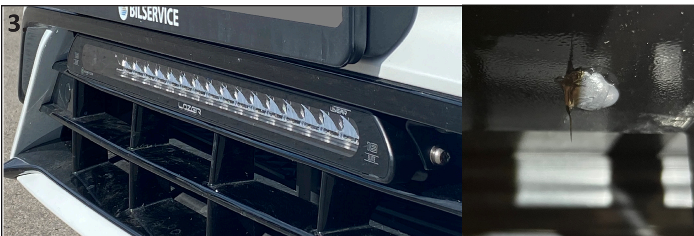
3. Montèr på vinkelfestene til lampen (pekende utover), fyll litt lim i hullet, og skru frast lampen med grov karosseriskruer 4,5mm.