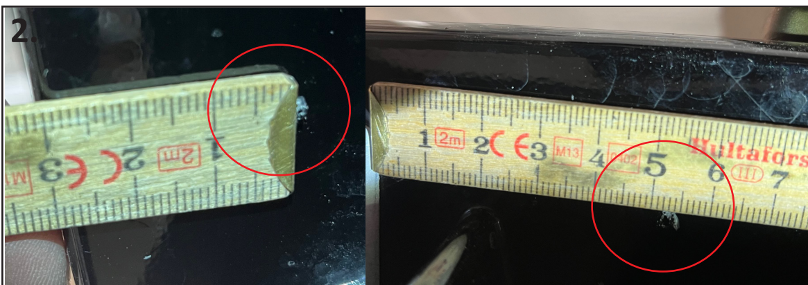
2. Etter at utskjæringen i grillen er ferdig. Merker du 3 cm inn fra kanten av fangeren, og 5,3cm fra siden, og bor 2mm hull. Samme på begge sider. Sidebrakettene skal peke "utover".